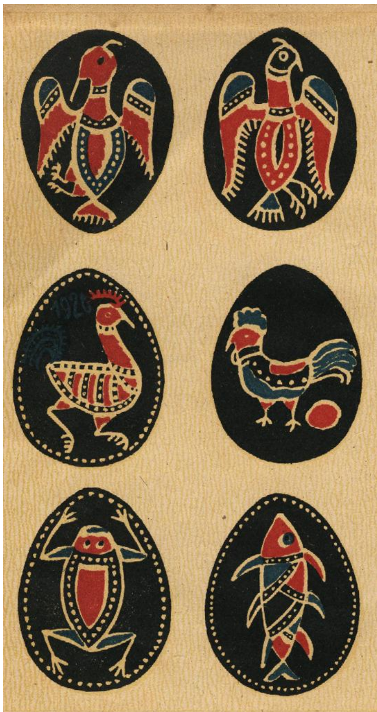
Culese din județul Dolj de N. Plopșor