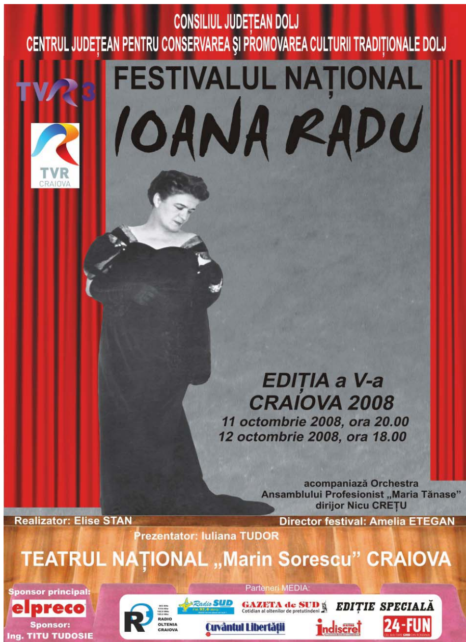
Afișul Festivalului „Ioana Radu”, editia a V-a, 2008