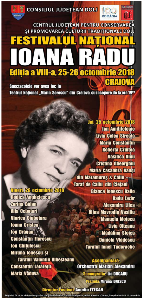
Afișul Festivalului „Ioana Radu”, ediția a VIII-a, 2018