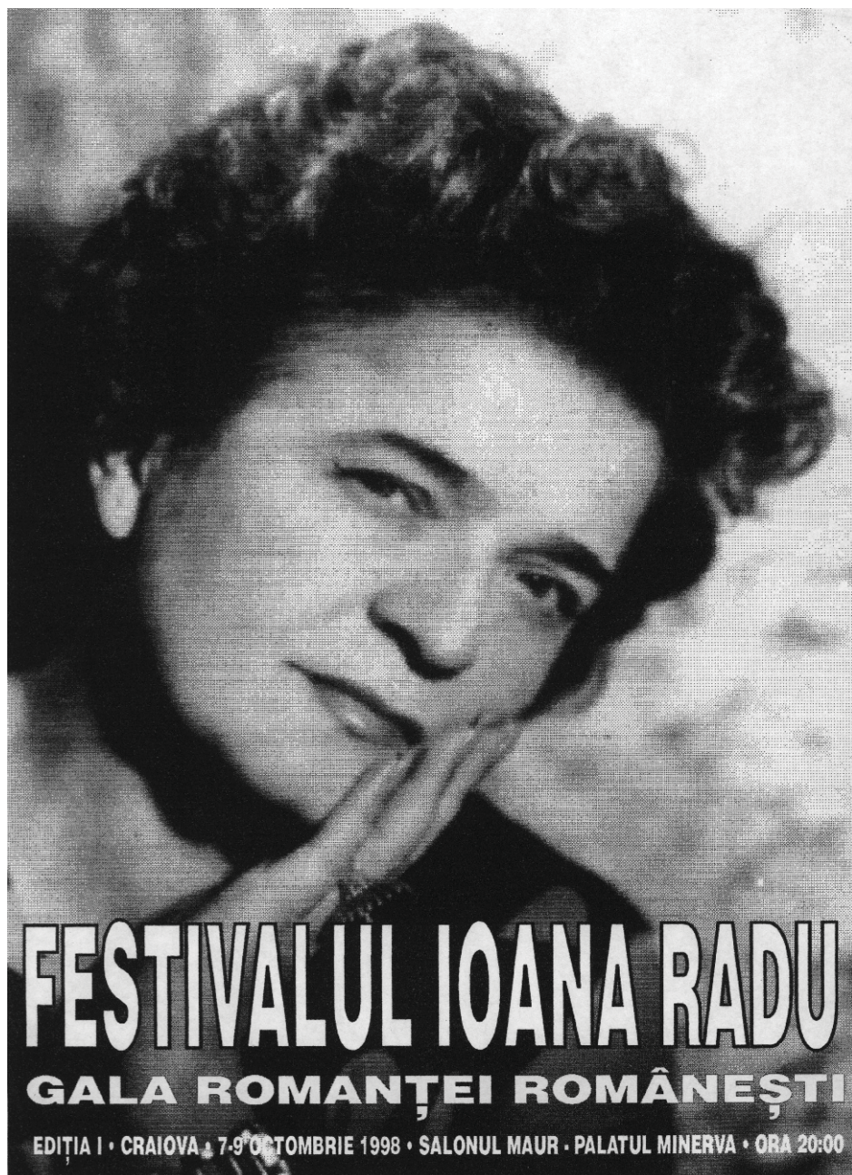
Afișul Festivalului „Ioana Radu“, ediția I, 1998