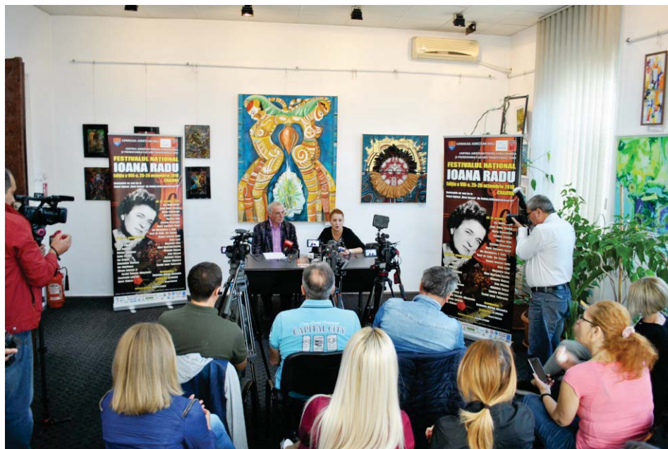
Conferința de presă a Festivalului „Ioana Radu“, ediția a VIII-a, 2018