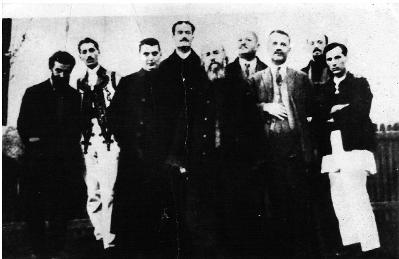
4 ianuarie 1927: membrii fondatori ai „Tovărășiei folcloriștilor olteni“ la Ștefănești – Vâlcea.