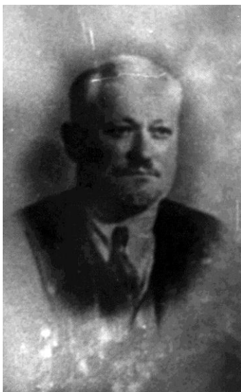
Poză din 1935