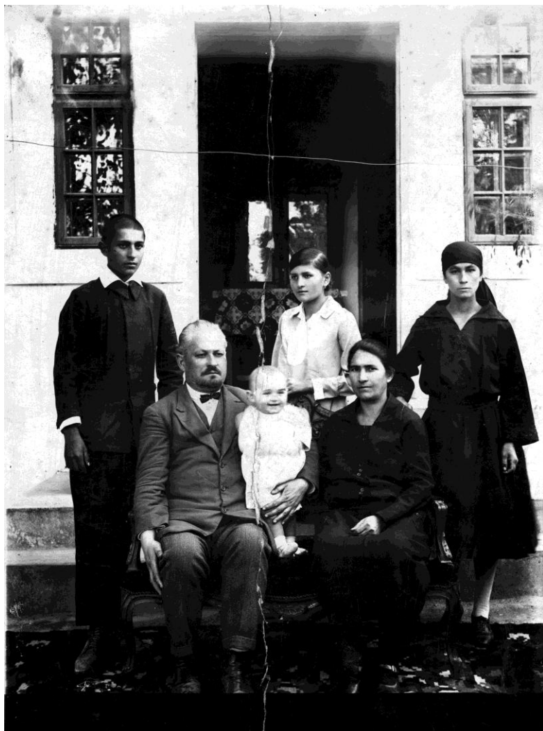
În mijlocul familiei